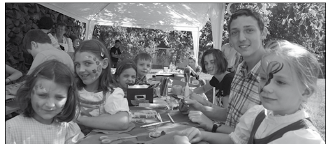
Viel Spaß gab's beim Basteln, Malen und Brotbacken

Das Patrozinium unserer Pfarrkirche (am Fest Maria Geburt) feierten wir am Sonntag, den 8. September sehr feierlich. Der Festgottesdienst wurde vom Kirchenchor musikalisch umrahmt. Im Anschluss folgten bei herrlichem Wetter viele Pfarrangehörige und Gäste der Einladung zum Pfarrfest in den Pfarrgarten. Den biblischen Alltag zeigten die Jugendlichen bei diversen Stationen; Marterlwanderung, Kirchenbesichtigung, Information über die Kleidersammlung, Messweinverkostung und ein Schätzspiel rundeten das Programm ab.