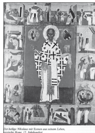
Der heilige Nikolaus mit Szenen aus seinem Leben, historische Bäume, 15. Jahrhundert

Fast 1700 Jahre nach seinem Tod ist der legendenumwobene Bischof von Myra einer der populärsten Heiligen sowohl der Ost- wie der Westkirche. Sein Eintreten gegen Unrecht und für die Armen ist auch heute noch ein leuchtendes Beispiel. Er verweist uns zu Adventbeginn auf Jesus, der selbst die Liebe ist und dessen Liebe wir wie Bischof Nikolaus weiterschicken sollen. Zur Erinnerung an den guten Bischof von Myra stellen die Kinder am Vorabend des Nikolaustages Schuhe bzw. Stiefel vor die Tür und hoffen, dass sie mit leckeren Süßigkeiten und Obst gefüllt werden. Nikolausfeiern gibt es auch in unserer Kirche und im Kindergarten.